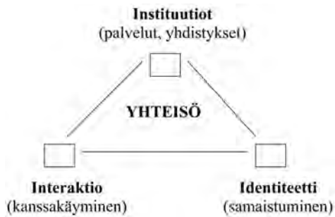
KUVIO 1. Paikallisyhteisön elementit

ta, jolloin se on syntynyt ihmisten välisessä vuorovaikutuksessa ja käytännössä. Symbolinen yhteisyys voi olla myös ideologista, jolloin sen uusintamisesta huolehtivat ideologiset koneistot.